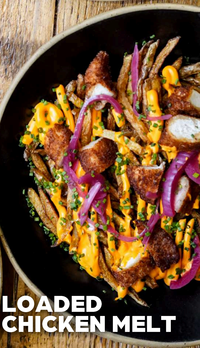
LOADED CHICKEN MELT