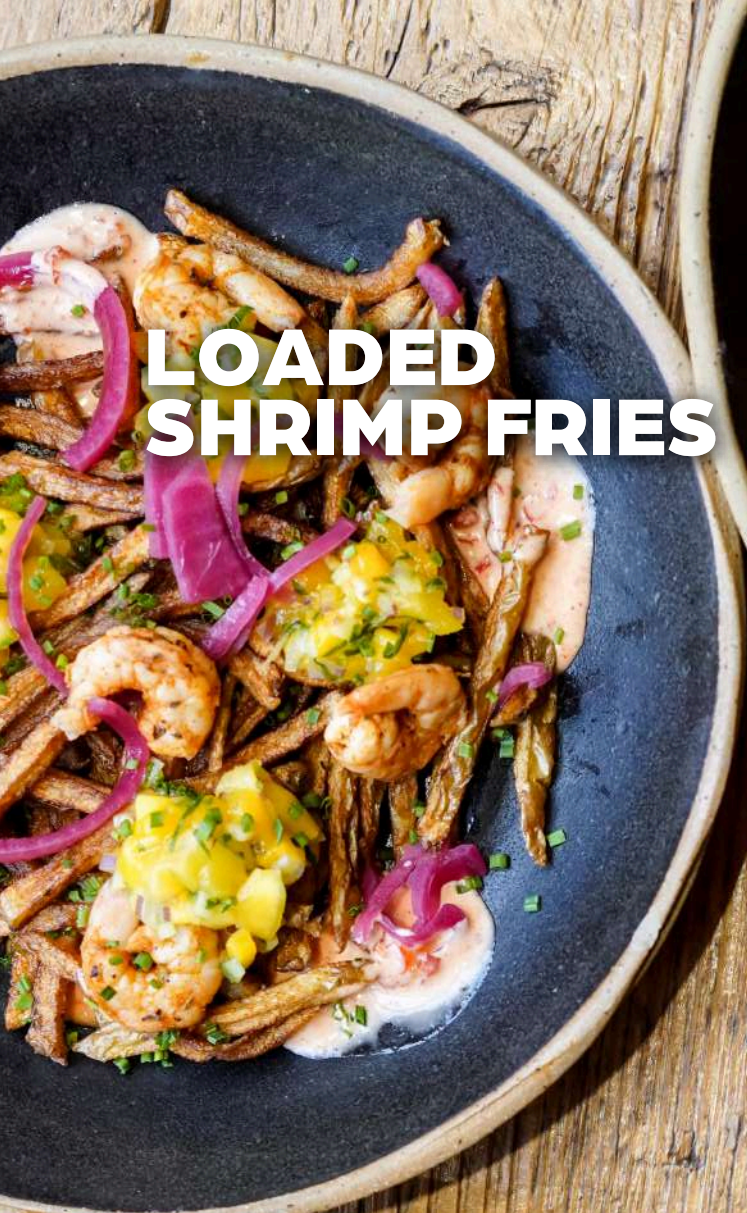
LOADED SHRIMP FRIES