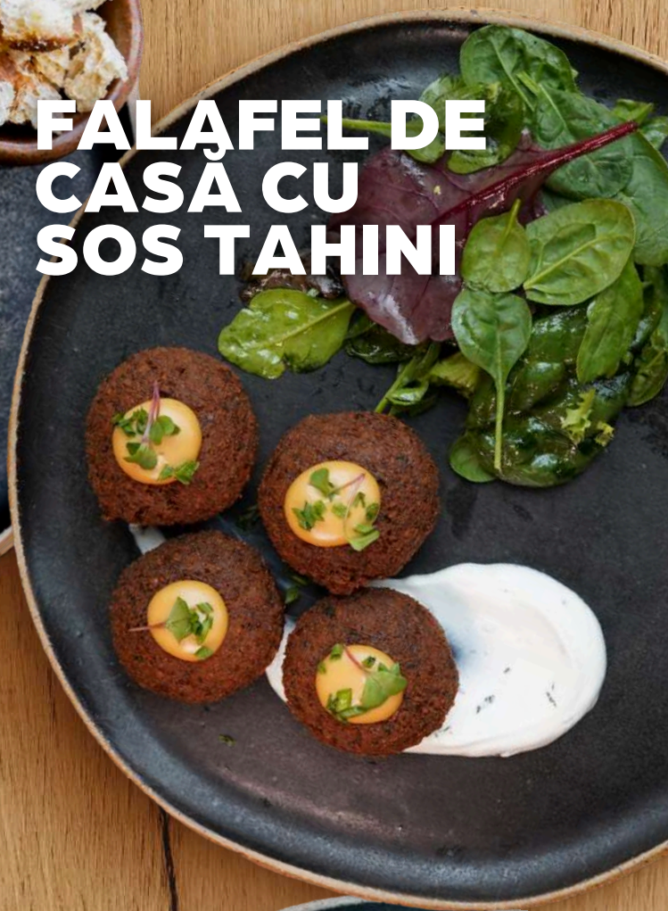
FALAȘEL DE CASĂ CU SOS TAHINI