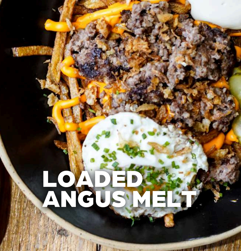
LOADED ANGUS MELT