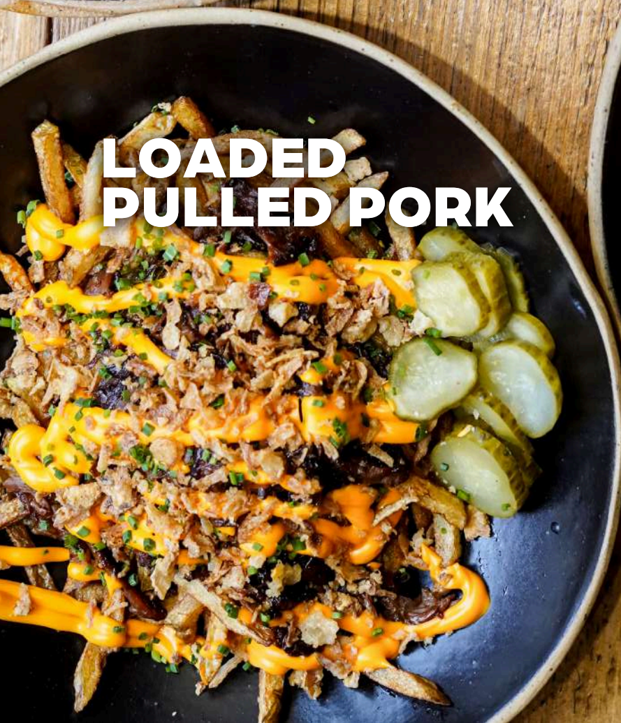
LOADED PULLED PORK