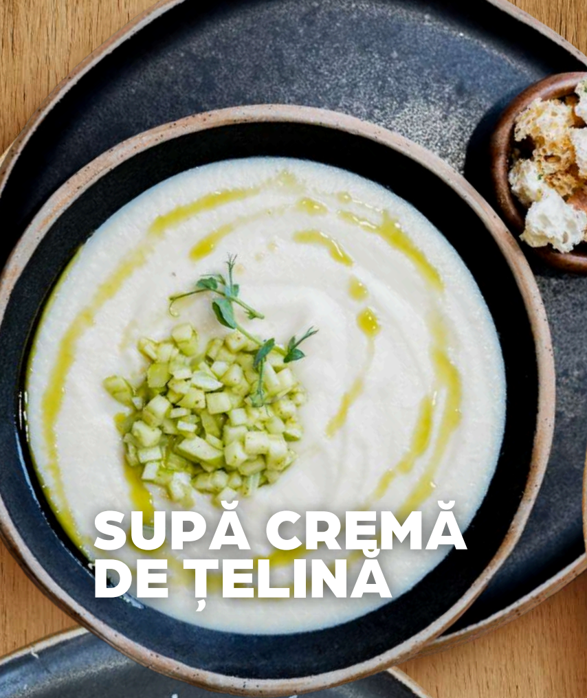
SUPĂ CREMĂ DE ȚELINĂ