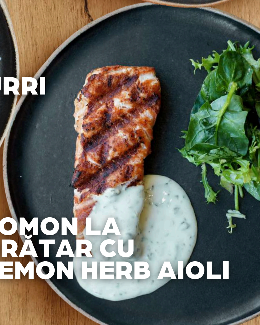
SOMON LA GRĂȚAR CU LEMON HERB AIOLI