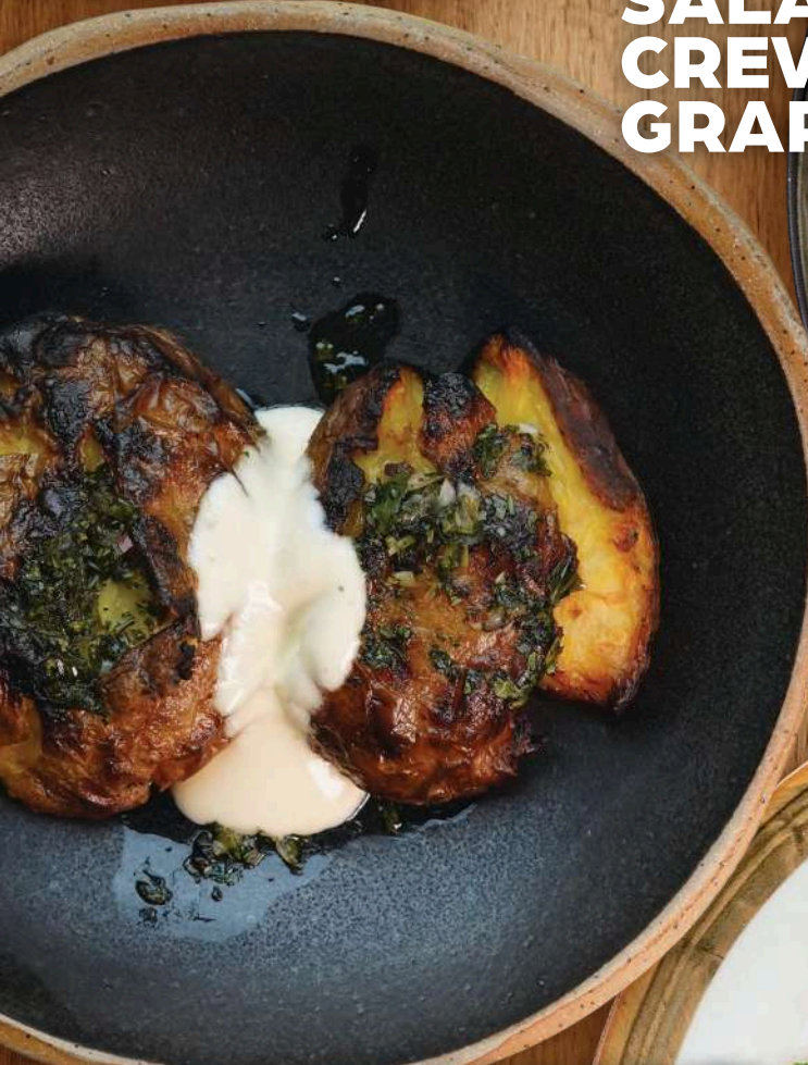
CARTOFI ZDROBIȚI LA CUPTOR