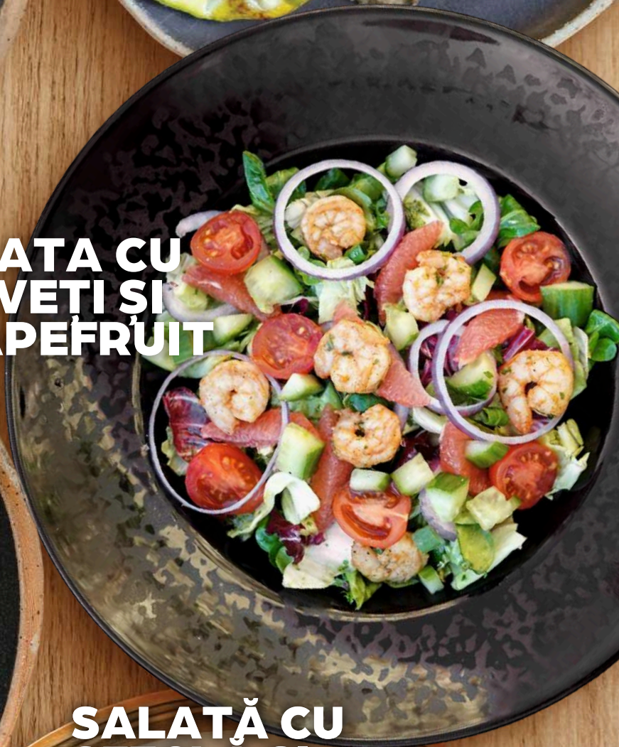
SALATA CU CREVETI ȘI GRAPEFRUIT