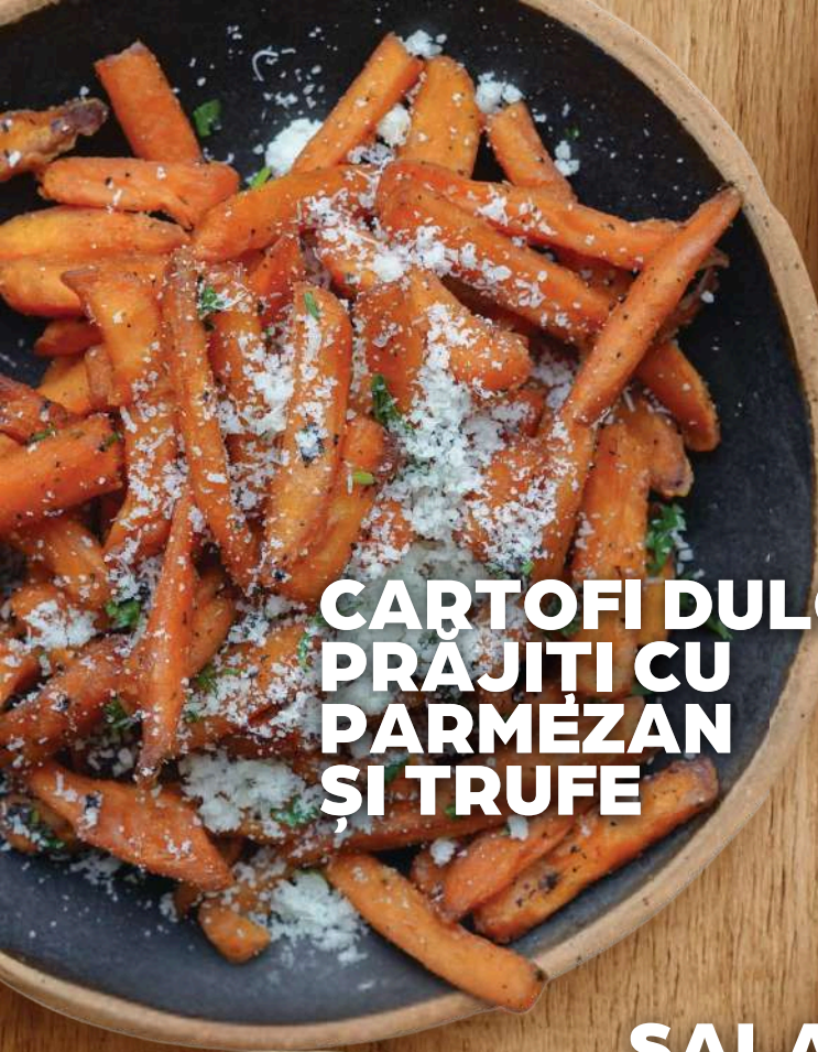
CĂRTOFI DULCI PRAJITI CU PARMEZAN ȘI TRUFE