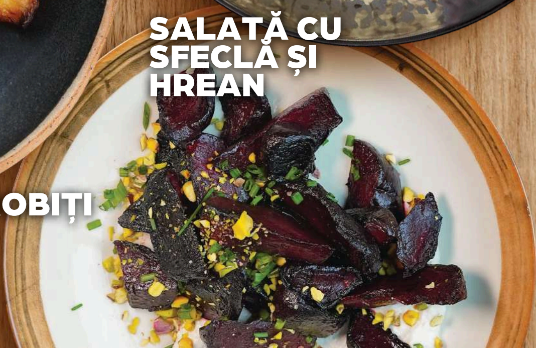
SALATĂ CU SFECLĂ ȘI HREAN