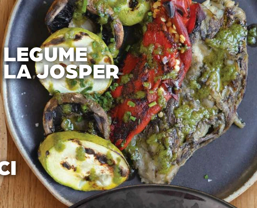
LEGUME LA JOSPER