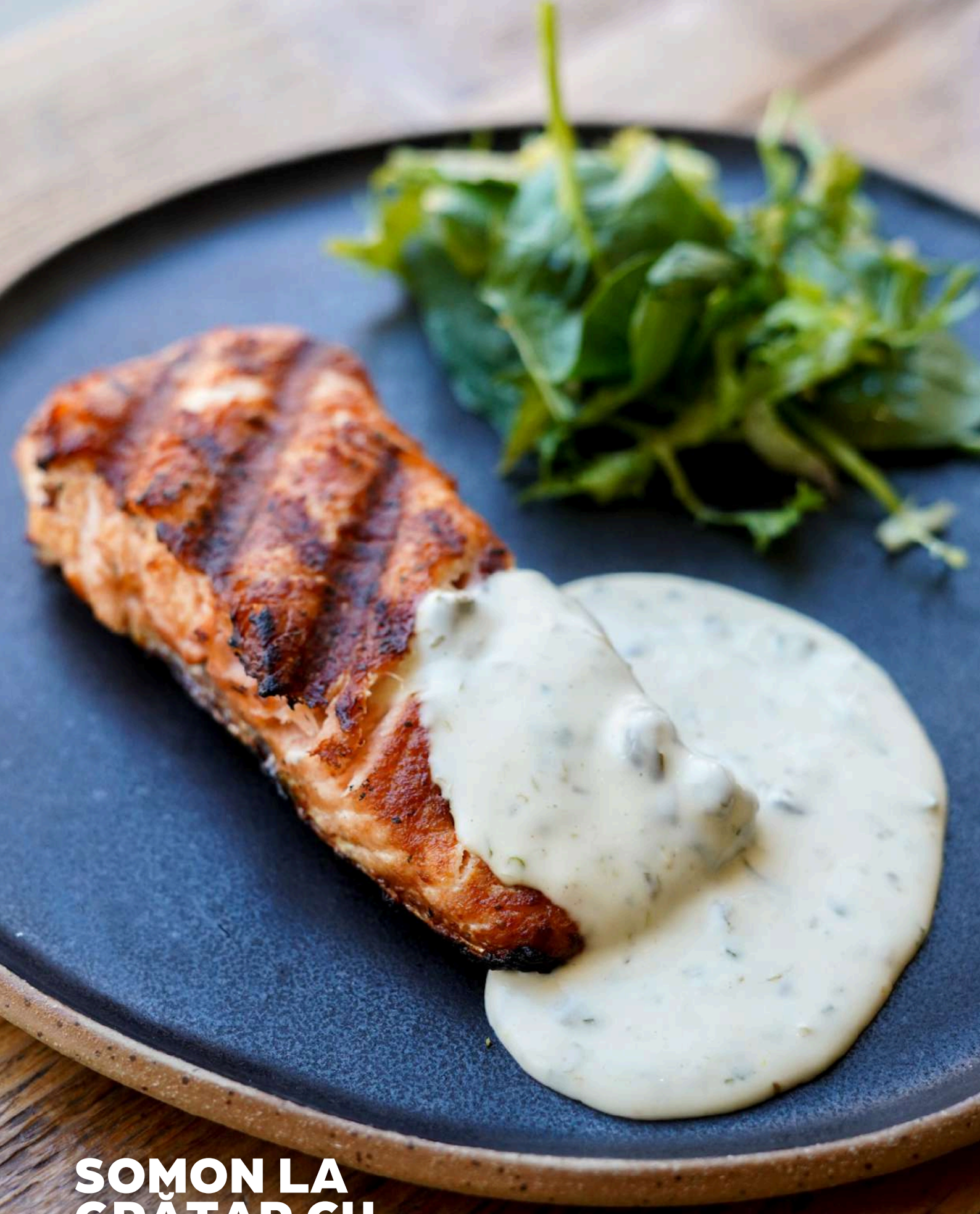
SOMON LA GRĂȚAR CU LEMON HERB AIOLI