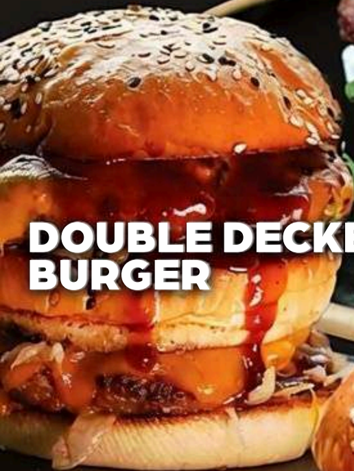
DOUBLE DECKER BURGER